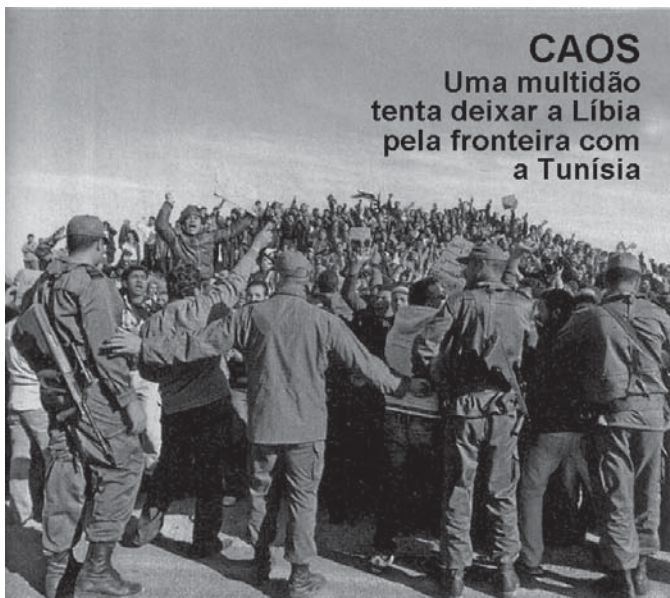
CAOS Uma multidão tenta deixar a Líbia pela fronteira com a Tunísia

Os postos de fronteira na Líbia estão lotados de gente desesperada para sair. [...] “O meu povo me ama e morreria por mim”, disse Muammar Khadafi na semana passada. [...] Pelo menos 200 mil pessoas, entretanto, já foram embora do país. [...] A saída em massa coloca o Ocidente em dúvida se vale a pena enviar tropas para ajudar os rebeldes a derrubá-lo.